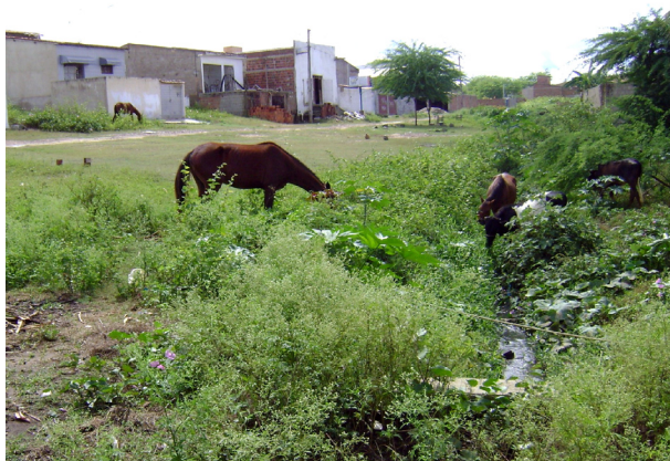
Imagem 01: Espaço utilizado por crianças para brincar

A Unidade Básica de Saúde da Família, quando os pesquisadores foram a campo estava passando por reforma e funcionando temporariamente em uma sala da SAB. O PSF tem sua participação no lazer da comunidade, como coloca Yara Carvalho (2008, p.113):